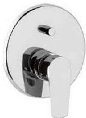
KIT DOCCIA QUADRO

Marche rubinetteria: INTESA serie Ten-Kris o similare